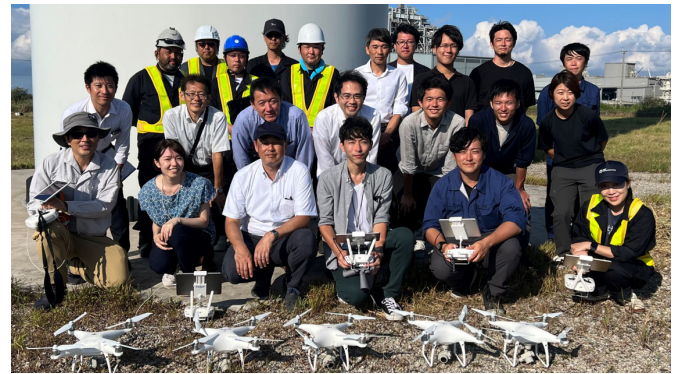
Fig 2 Wake measurement by drone, September 28, 2023

当研究室、ジャパン・リニューアブル・エナジー(株)、東京ガス(株)は、JSTのA-STEP産学共同(本格型)に採択され、2022年10月1日～2025年3月31日まで「洋上ウィンドファームの採算性と耐久性の最適設計に資する日本型ウエイクモデルの開発と社会実装(JPMJTR221C)」を実施中である。本プロジェクトでは、響灘ウインドエナジーリサーチパーク合同会社が所有する北九州市響灘地区の風力発電設備(3.3MW風車×2基)を活用している(図2)。