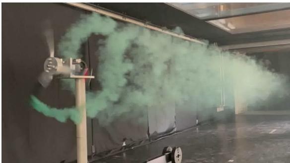
Fig 1 Wind turbine wake by wind tunnel experiment

大型風車の運転(ブレードの回転)に伴い、風車下流領域には速度欠損領域と、その時間・空間変動(乱流強度の増加)が形成される(図1)。これらの流動現象は風車ウエイクと呼ばれる。複数の大型風車群から構成される大規模洋上ウィンドファームでは、風車ウエイクが相互に干渉し、下流側に位置する風車の発電量低下や、風車内外の故障などを引き起こす可能性がある。よって、上流側に位置する風車群が形成する風車ウエイクの影響を正しく評価し、風車間の離隔距離などを適切に決定することが不可欠である。